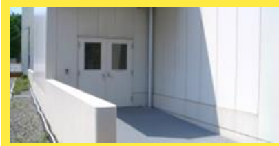
② ひがし棟 2番入口