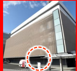
① 中央診療棟 ICU入口