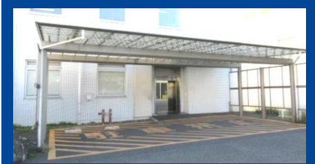
③ ひがし棟 3番入口