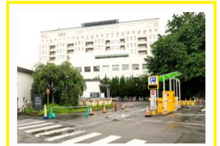
入構ゲート ※ 駐車券 を取って通過