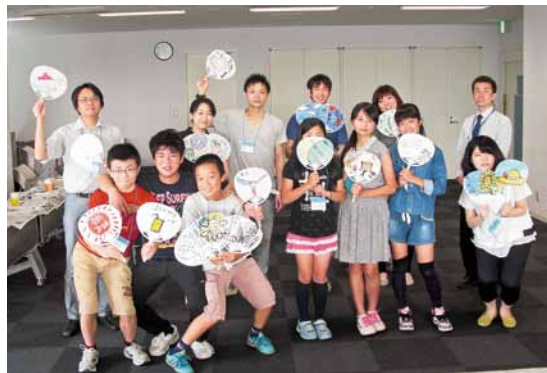
絵の授業を受けて作った団扇を認知症高齢者にプレゼントしました

認知症の人は孫に会うと「うれしそうにしている」という、認知症疾患医療センターの調査結果などから、「子どもの認知症への正しい理解は重要」と考え、4日間に渡り開催。小・中学生6名が認知症の勉強、認知症の人が暮らすグループホームの訪問、パンフレット作成に挑戦しました。