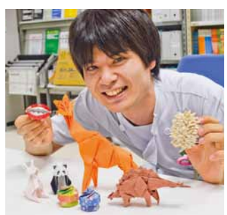
ステゴサウルスは自信作です

特技は折り紙です。幼少の頃から興味があり、何時間もかけて複雑なものを作っていました。自分の技術的な追求もいいですが、今は周りの人に喜んでくれたときにうれしく感じます。知人のお子さんに配ったり、リクエストに応じて折ったり、好きな動物の折り方を教えてあげたり。稀に、折り紙好きの患者さんと、(薬の説明はしつつも)「和紙で折ると……」など、紙へのこだわりで盛り上がることもあります。患者さんからいただいた作品は今も大切にしています。