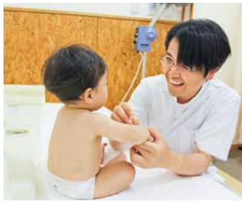
子どもの鍼治療時間は10分前後。全身をさするように刺激します

さらに、子どもの鍼も行っています。関東ではあまりなじみがありませんが、関西方面では昔から子どもの鍼治療が行われており、使い捨ての刺さない鍼を使っています。子どもにとって心地良い、眠くなるような刺激量です。夜泣き、疳(かん)の虫、オネショなどでお悩みの親御さんが利用されています。