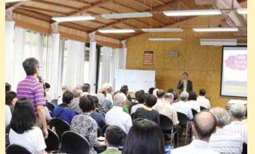
質疑応答コーナーでは多くの質問が寄せられ、関心の高さをうかがうことができました(次回は11月28日に開催予定)

千葉大学柏の葉キャンパスにて、市民公開講座を定期開催しています。今年4回目は9月26日に開催。漢方の歴史から紐解く「医」と「食」の関わりや、漢方医学を活用した健康へのヒントについての講演があり、100名を超える参加者は真剣に聞き入っていました。