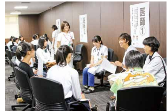
新人職員・学生に勉強方法などを積極的に質問する高校生

県内から400名を超える関係者が集結し、団塊の世代が75歳を迎える2025年問題が10年後に迫った今、どのような準備を進めていくべきか議論しました。同時開催の高校生向けプログラム「千葉県内で働く医療者になろう」には、35名もの高校生が参加しました。