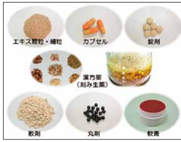
漢方薬の剤形は様々