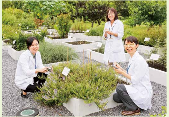
「薬草園の見学だけでも、お気軽にお越しください」と薬剤師たち