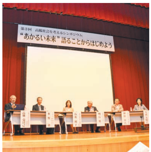
パネルディスカッションでは、「あかるい未来」について活発な議論が交わされました