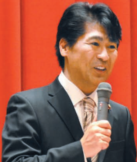
田村憲久厚生労働大臣