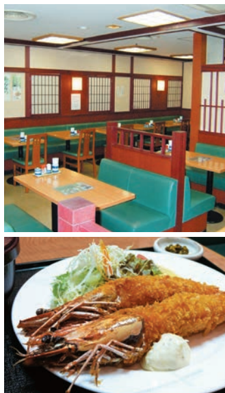
海老フライ定食1,130円

この店の一日は「本日の予約患者数」のチェックから始まります。混雑度を予想し、準備スタート。開店は朝8時。朝限定の和食セットやトーストセットなどは、遠方からのお客さまに喜ばれています。(朝メニューは10時まで)