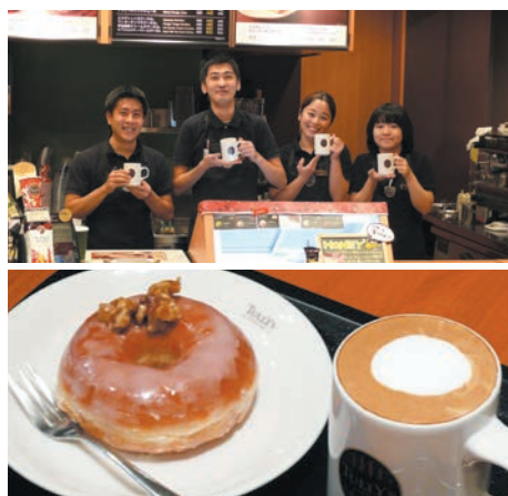
ハニーウォルナツドーナツ200円 カフェラテショートサイズ340円