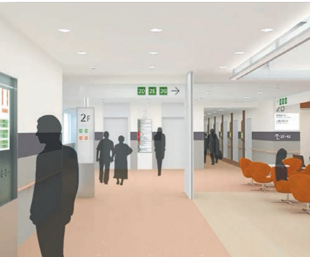
ひろびろとした2階エレベーターホール

新しい外来診療棟の完成は、面積や診察室の数が大幅に増えるだけではありません。外来診療の質や内容も大きく向上します。