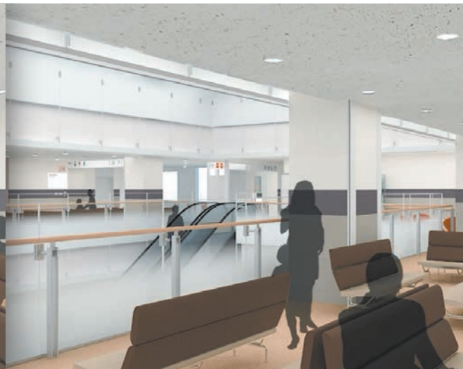
3階までの吹き抜けアトリウムに面した2階待合ホール