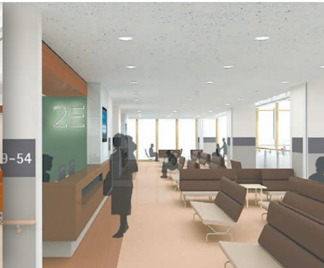
循環器系、呼吸器系が入る予定の2階外来受付前