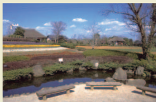
懐かしい農村の風景がひろがるふるさと農園

園内では、千葉に伝承されてきた農文化も体験することができます。事前申込制になりますが、年間を通じて、太巻き寿司、ソバ打ちといった体験教室を開催。12月には「おせち料理」「布ぞうり」「生芋からのコンニャク」「正月の輪飾り」「親子で楽しむ餅つき」を募集しています。