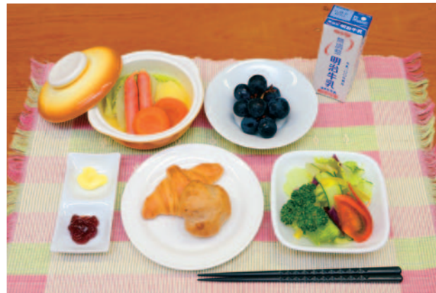
《朝食特別メニュー》

食事内容もグレードアップし、朝食の焼きたてパンの種類が増え、丼物やめんなどのメニューも充実しました。