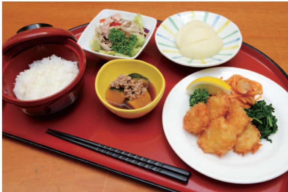
《夕食特別メニュー》

ほたて貝柱のフライ、ほうれん草のバターソテー、かぼちゃのそぼろあんかけ、きのこベーコンのサラダ、白米、フルーツ