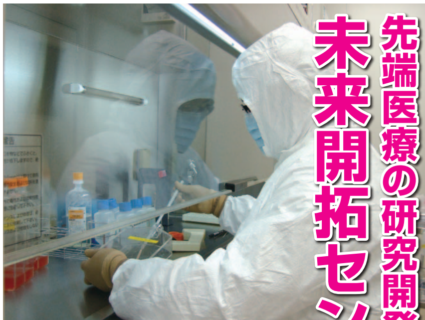
細胞調整室で研究中の研究員