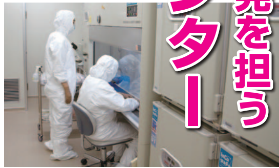
高レベルで無菌状態を保つ細胞調製室