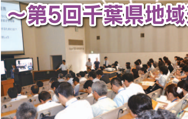
第1部「行政と医療者の対話」の様子