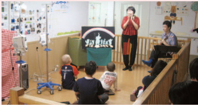
パネルシアターのおはなしに聞き入る子どもたち