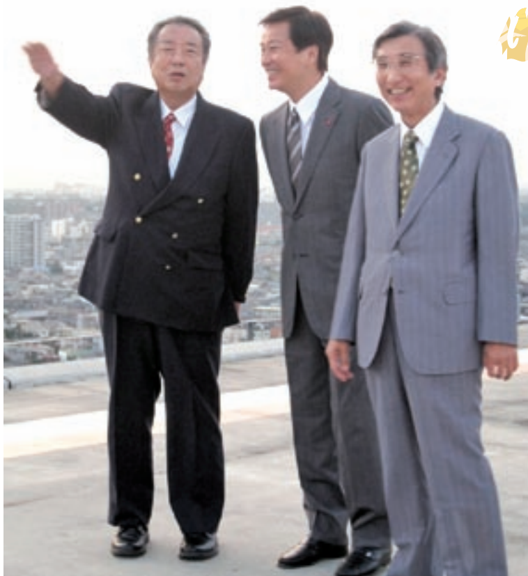
ひがし棟のヘリポートを視察する森田県知事(中央)と藤森県医師会会長(左)。右端は河野病院長。

ひがし棟特別病室も視察 森田知事は到着後まず、ひがし棟のヘリポートを視察。夕暮れの千葉市街を一望しながら、藤森県医師会会長や河野病院長とドクターヘリの