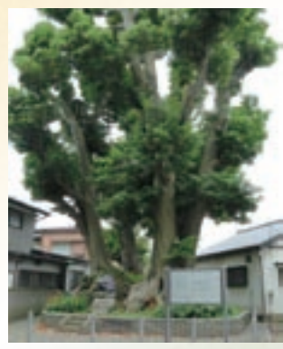
医学部構内外に7カ所ある七天王塚(千葉市指定文化財)