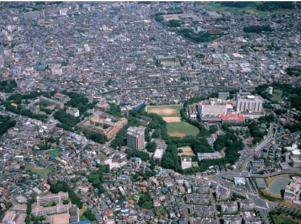
亥鼻キャンパス全景(右端が千葉大学病院、写真中央左の田の字型の建物が医学部・大学院医学研究院)